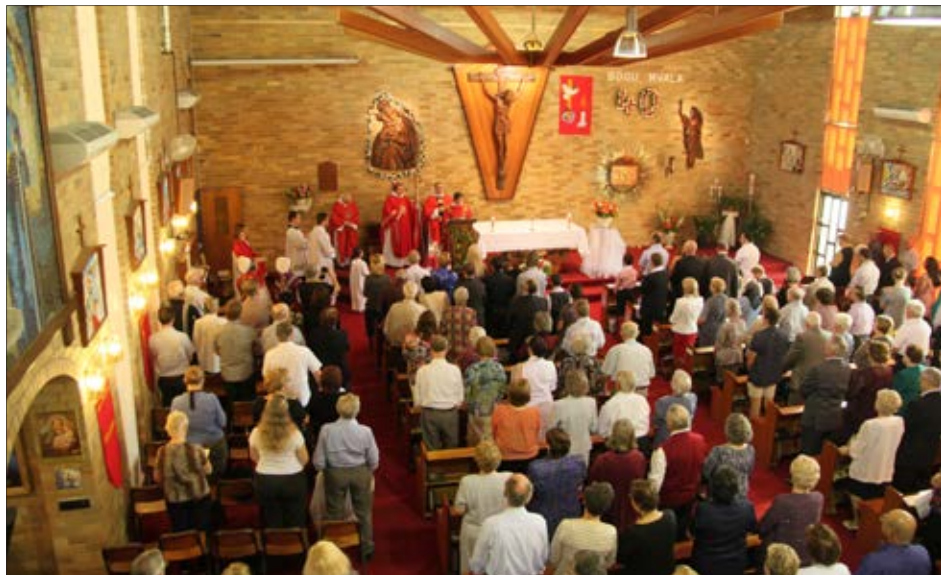
Zahvalna sv. maša 13.10.2013 pri Sv. Rafaelu ob naših jubilejih