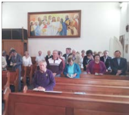
Zbrani pri Božji službi - in prostora je še dovolj