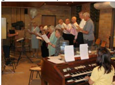
Mešani cerkveni pevski zbor je navdušil