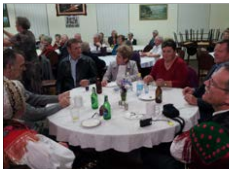
Po večerji v dvorani