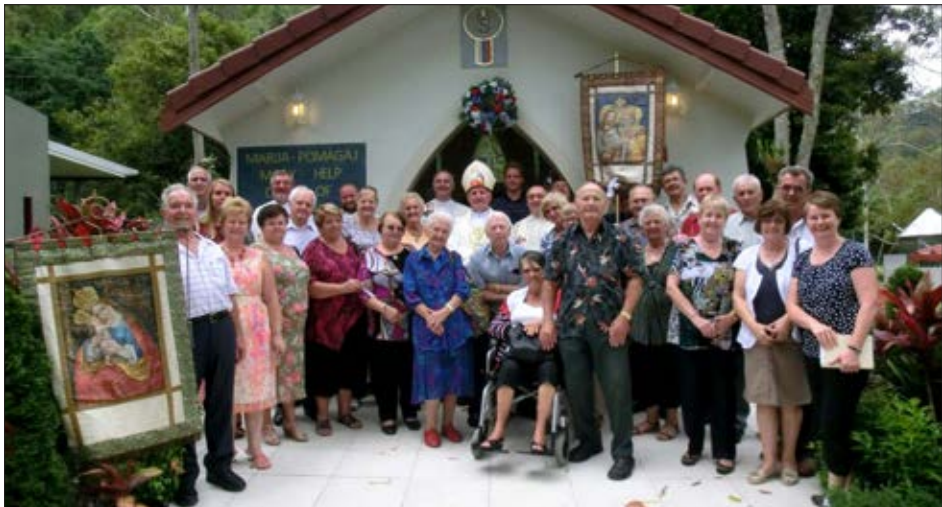
Končno nekaj oddiha! Lep skupni teden na obali oceana na Gold Coastu, vmes pa smo poromali v Marian Valley in obhajali bogoslužje z rojaki iz Kraljicini deželi 27.1.2016. Po obisku Marijine hiše smo imeli skupno kosilo, dobrot več kot dovolj. Še se nam lahko pridružite, da nas bo več!