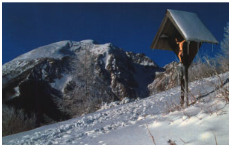
Božje znamenje pred Roblekovim domom (1657m); v ozadju zasneženi Stol (2236m)

Kako dolgo bo list izhajal? Pri tem igrajo vlogo razni dejavniki. Eden od glavnih je zavednost rojakov. Zlati jubilej je lepa prilika, da ponudite list nekemu, ki ga še nima in da si ga naroči. Vam, dragi naročniki, pa hvala za Vašo zvestobo našim Mislim.