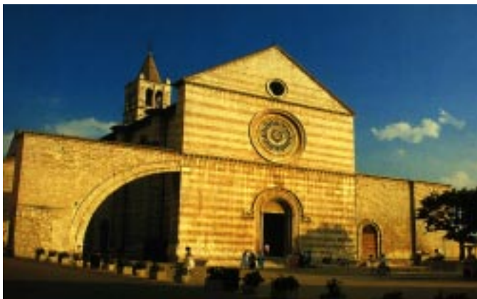
Bazilika svete Klare v Assisiju, kjer počiva neiztrohnjeno telo sv. Klare in kjer je bil najprej pokopan sv. Frančišek.

Frančišek in Leon sta šla potem molče po oljčnem gaju, zmračilo se je in vse sivo je bilo na poti. Iz sivine sta se izmotala še dva druga brata in se pridružila Frančišku in Leonu.