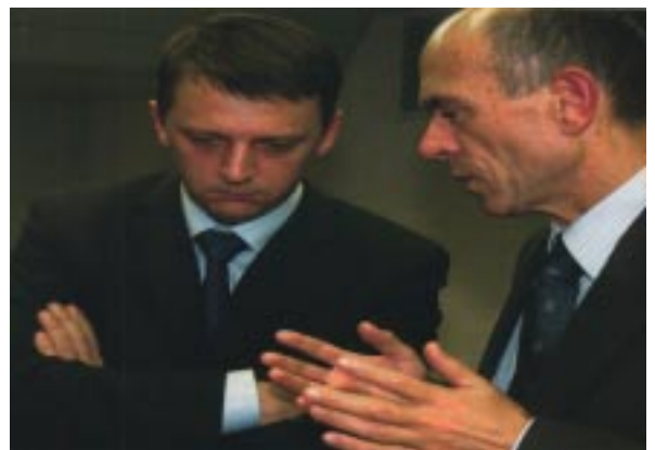
Novi predsednik države RS dr. Janez Drnovšek (desno) v pogovoru z novim predsednikom slovenske vlade Antonom Ropom (levo).

Ljudska stranka in Demokratična stranka upokojencev), ki imajo skupaj s poslancema narodnosti v parlamentu dvetretjinsko večino. Tako široka podpora je za vlado pomembna zaradi ustavnih sprememb, ki jih pripravlja pred vstopom v Evropsko zvezo in NATO, kamor naj bi se