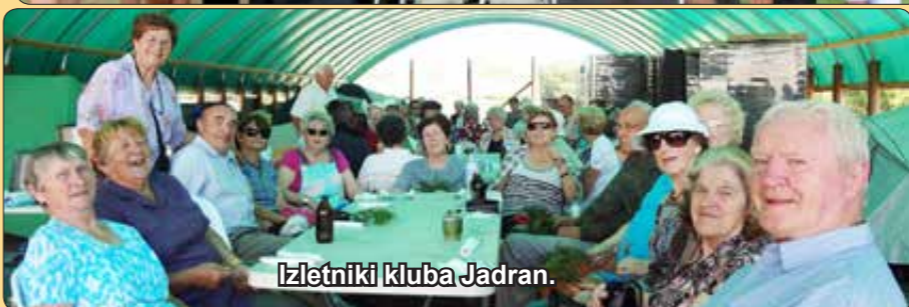
Izletniki kluba Jadran.