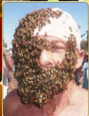
Obiskovalci so si ogledali, kako živijo in delajo čebele, čebeljo brado, kako se izdeluje med in izdelki iz medu.