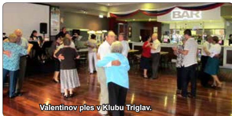
Valentinov ples v Klubu Triglav.