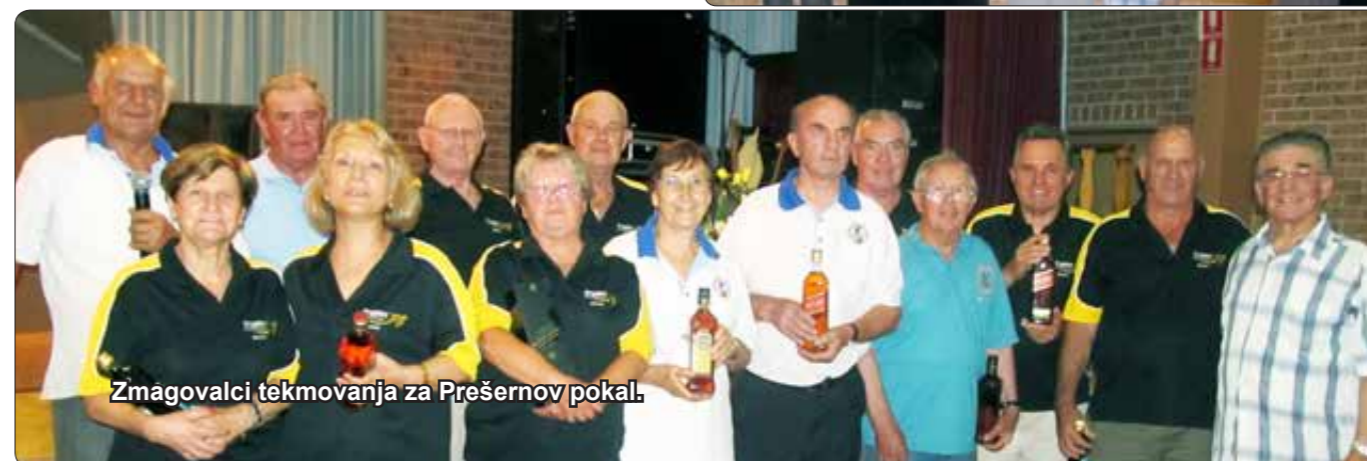
Zmagovalci tekmovanja za Prešernov pokal.