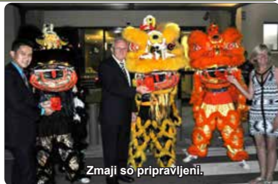
Zmaji so pripravljeni.

Kolikor vem, Valentinovo v današnjem pomenu ni bil nikoli pravi slovenski običaj, ampak po več desetletjih življenja v Avstraliji smo se privadili slaviti tudi veliko praznikov naše nove domovine in Valentinovo je eden od najbolj prijetnih praznikov. Kdo ne bi praznoval dneva, ki je posvečen ljubezni in lepim spominom na mladostna leta? Veliko mladih in malo manj mladih