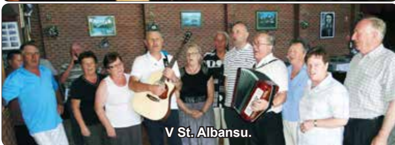
V St. Albansu.