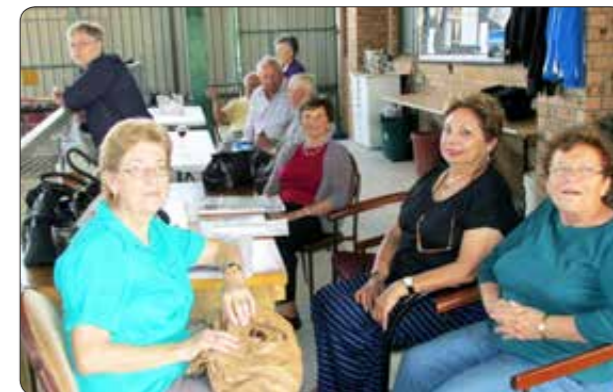
Prijatelji in obiskovalci na baliniščih pri pogovoru med tekmovanji.

Za prijateljsko in informativno tekmovanje smo sestavili šest tekmovalnih trojk - dva od gostov - direktorjev, ki niso imeli pojma o balinanju in k vsaki dvojki po enega od triglavskih balinarjev, ki naj bi novince vodili in jim svetovali pri prvem srečanju s tem priljubljenim slovenskim športom. Kmalu so se tako vživeli v živahno tekmovanje, da jih je bilo kar