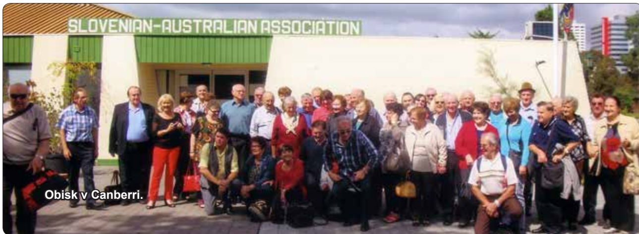
Obisk v Canberri.