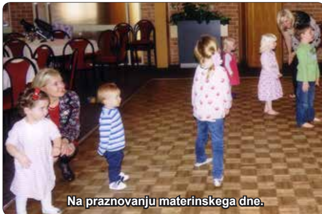
Na praznovanju materinskega dne.