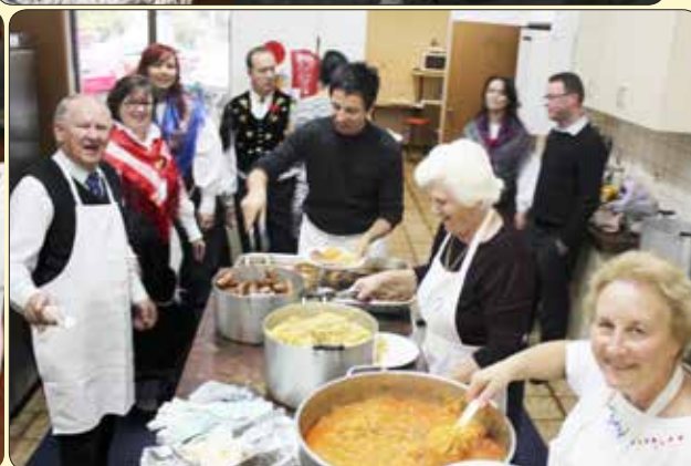
Kuharska ekipa, ki je pripravila večerjo.