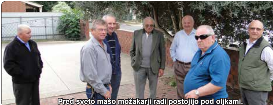
Pred sveto mašo možakarji radi postojijo pod oljkami.