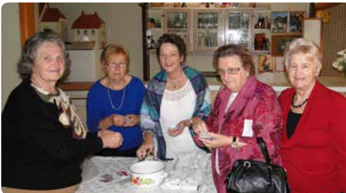
V nedeljo, 25. maja 2014, so naše pridne gospodinje s sodelavkami in sodelavci pripravili BBQ kosilo. Bog jim vsem povrni! Prijetno je druženje v dvoranci, še posebej sedaj, ko se ne srečujemo več vsako nedeljo, in dobro ter okusno kosilo – s prihodki od takšnih prireditev pa pomagamo kriti finančne stroške cerkve in naših dejavnosti.

poznamo, saj smo ga mnogi tudi srečali ob njegovih obiskih v Avstraliji in tudi v Sloveniji. Slika obeh papežev pred oltarjem nas je združila z dogajanjem v Vatikanu, kjer se je več sto tisoč ljudi udeležilo slovesnosti na trgu sv. Petra, kar smo lahko spremljali tudi popoldne na televiziji.