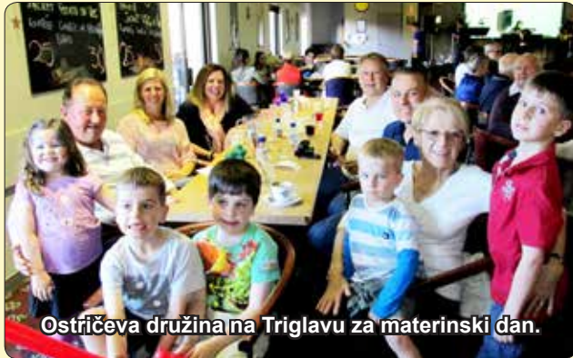
Ostričeva družina na Triglavu za materinski dan.