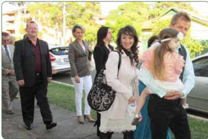
Tudi druga in tretja generacija Slovencev se nam je pridružila pri velikonočni procesiji v Merrylandsu.