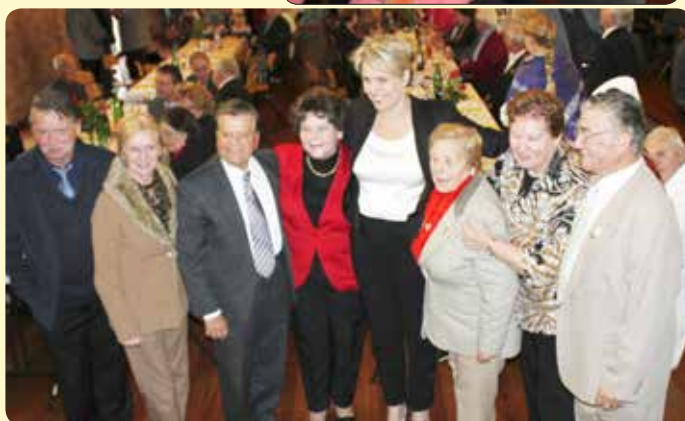
Rojaki s Tanyo Pliberšek.