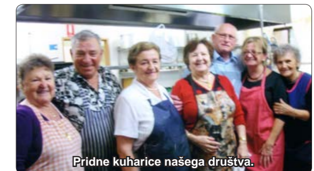
Pridne kuharice našega društva.