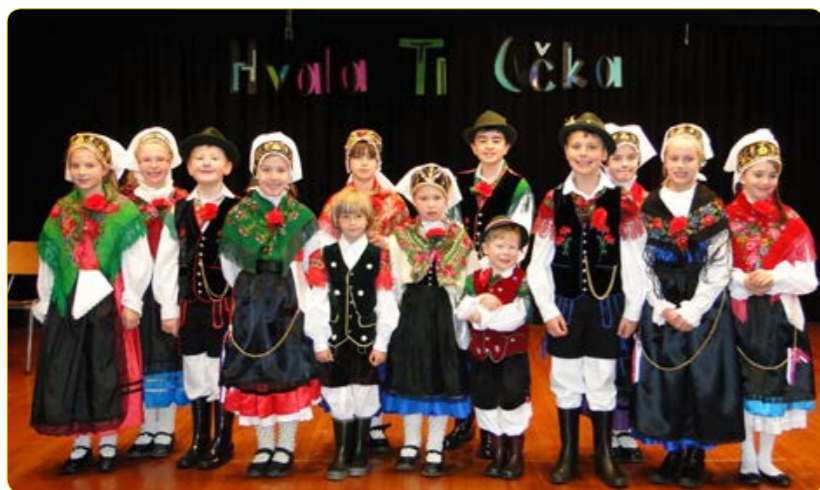
Učenci Slomškove šole so nam pripravili lep program za očetovski dan.