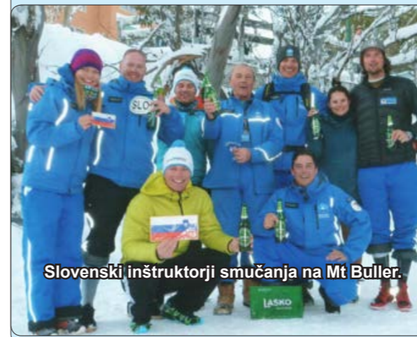
Slovenski inštruktorji smučanja na Mt Buller.