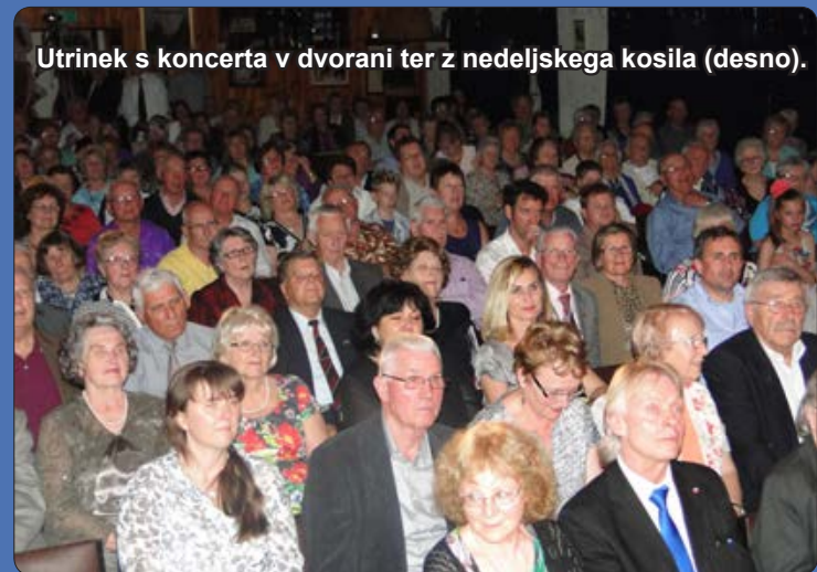
Utrinek s koncerta v dvorani ter z nedeljskega kosila (desno).