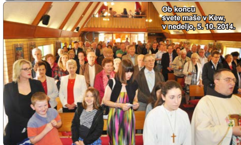
Ob koncu svete maše v Kew, v nedeljo, 5. 10. 2014.