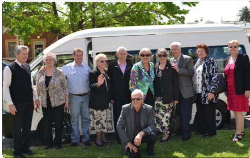
Rojaki iz Wollongonga v Kew.