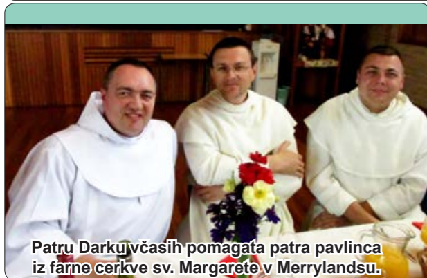
Patru Darku včasih pomagata patra pavlinca iz farne cerkve sv. Margarete v Merrylandsu.