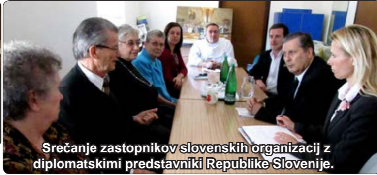
Srečanje zastopnikov slovenskih organizacij z diplomatskimi predstavniki Republike Slovenije.